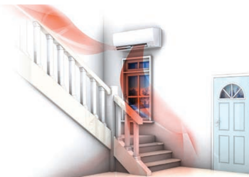
Kirigamine MSZ-FH tagab majas parema soojuse jaotumise

Mitsubishi Electricu soojuspumbad on tuntud madala mürataseme poolest. Ka Kirigamine MSZ-FH ei ole erand, siseosa müratase on vaid 20dB(A).