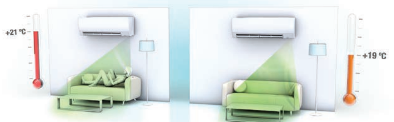
Inimese kohalolu tuvastav andur (Human Sensor) vähendab küttekulusid

Human Sensor on "väike tehniline ime", mis võimaldab täielikult kontrollida soojuspumba tööd. Andur tuvastab inimese asukohta ning viibimist ruumis. Vastavalt sellele suunab soojuspump ruumi õhuvoogu ning muudab kütmise/jahutamise temperatuuri. Andur on piisavalt tundlik eristamaks inimesi koduloomadest jt liikumistest ruumis. Uue anduri abil saab inimeste lahkumisel ruumist automaatselt tõsta või langetada ruumi temperatuuri 2 kraadi ulatuses. Esmapilgul väike muutus, mis aitab säästa pikas perspektiivis märkimisväärselt energiakulusid.